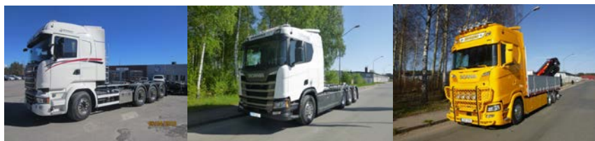
J Olofsson Jordbruk &amp; Skog